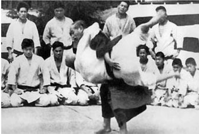
El maestro en una de sus clases

residencia de uno de los personajes más influyentes de la Era Meiji, el barón Yajiro Shianngawa, lo que dio al judo el espaldarazo definitivo sobre el resto de las artes marciales.